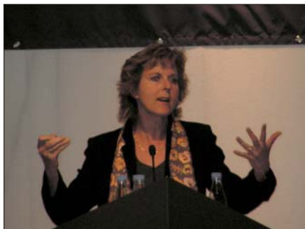
Connie Hedegaard talte varmt for ny miljøteknologi.