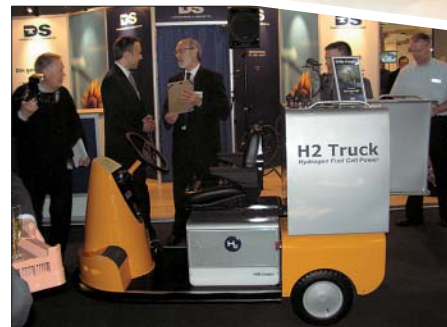
H2 Trucken vejer 450 kg og har en tophastighed på 15 km/t.

På Energistyrelsens stand kunne man få gode råd om solenergi og besparelser i længden i forhold til fossile brændstoffer.