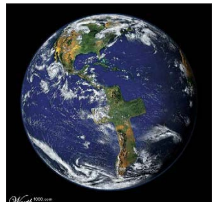
Skabte gud jorden?

Så til vores temmeligt middelmådige spørgsmål har det store, intelligente internet altså svaret, at hjemmesider, som blander gud og geologi sammen, ikke har svaret. Og nu er der øvrigt nogen, der skriver “Geologi er gud” på internettet. Det gør GeologiskNyt, for vi lægger denne artikel ud til alle de andre på vores hjemmeside. Gud ved, om det betyder, om vi har svaret? ■