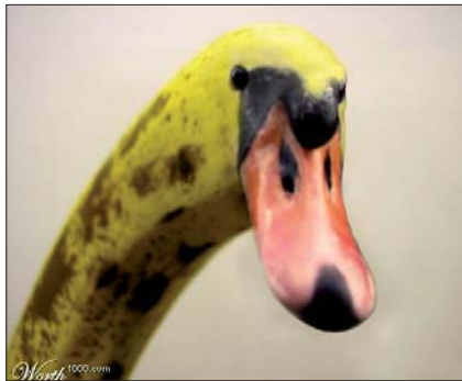
Er der en intelligens bag evolutionen?

svar på spørgsmålet. Her er et svar fra internettet. Forskydninger i Jordens skorpe udløser jordskælv, vulkanudbrud og tsunamier, og der er ingen vilje eller hensigt indblandet i det, foreslår en præst. Gud har simpelthen lavet naturlovene, og nu kører de så deres egne veje.