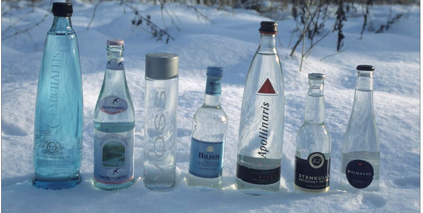
Et udvalg af udenlandsk flaskevand på det danske marked.