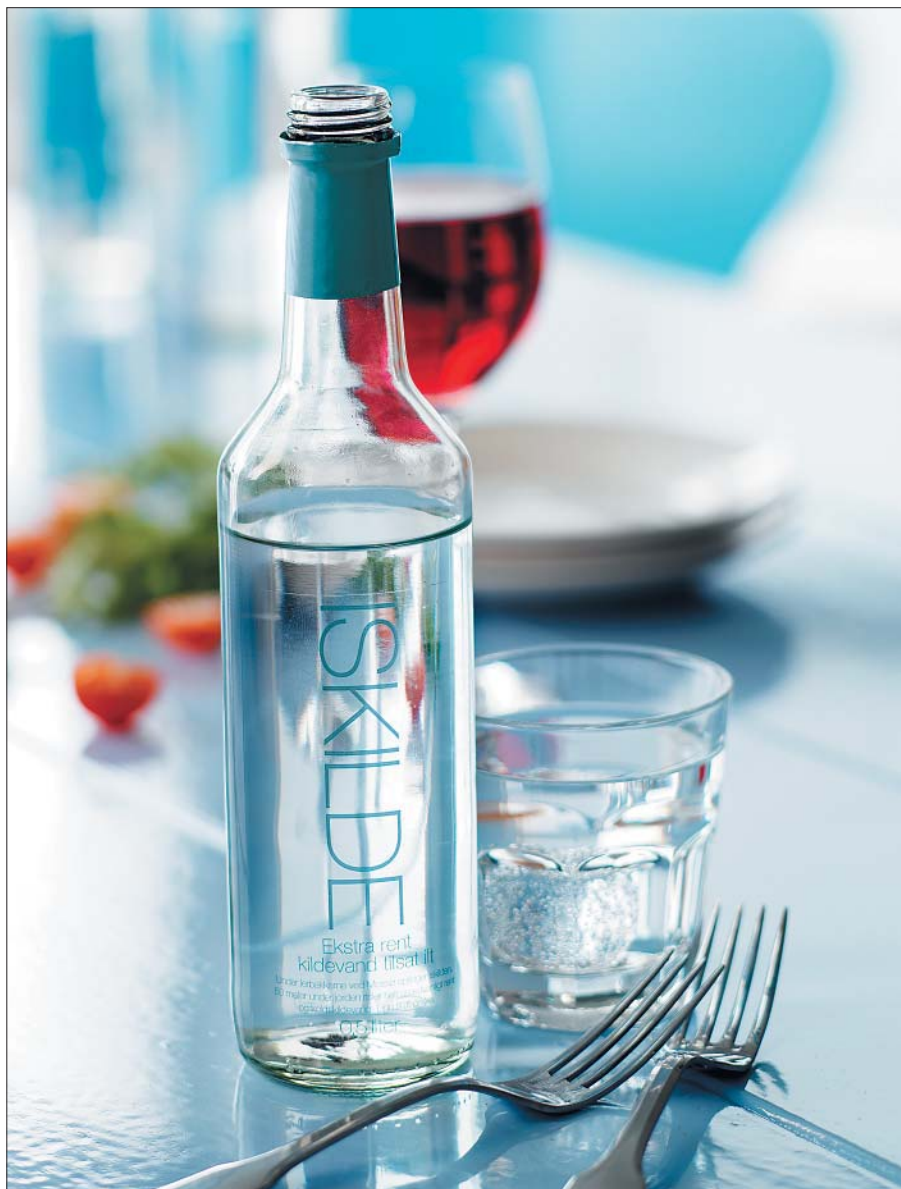
Iskilde fra Mossø ved Silkeborg er et af de nye danske designprodukter. Kilden skulle angiveligt være 5°C kold mod normalt 8-10°C for grundvand. Ifølge indvinderen er temperaturen dog svingende. Iskilde går efter en neutral smag, der kan rense munden mellem smagsindtrykkene under en middag.

Denne artikel har været bragt i Aktuel Naturvidenskab nr. 1, februar 2006. ■