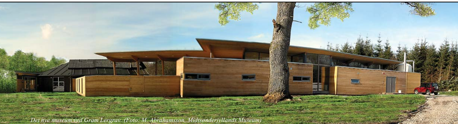
Det nye museum ved Gram Lergrav.