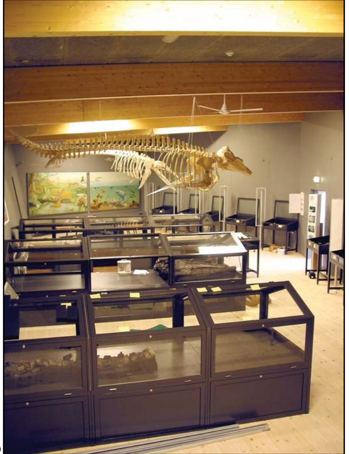
Udstillingshallen under opbygning.

I formidlingens tjeneste har vi fået fremstillet et stort maleri, der viser rekonstruktioner af de dyr, der er fundet i Gram Leret samt et der, ud fra fund i Tyskland og