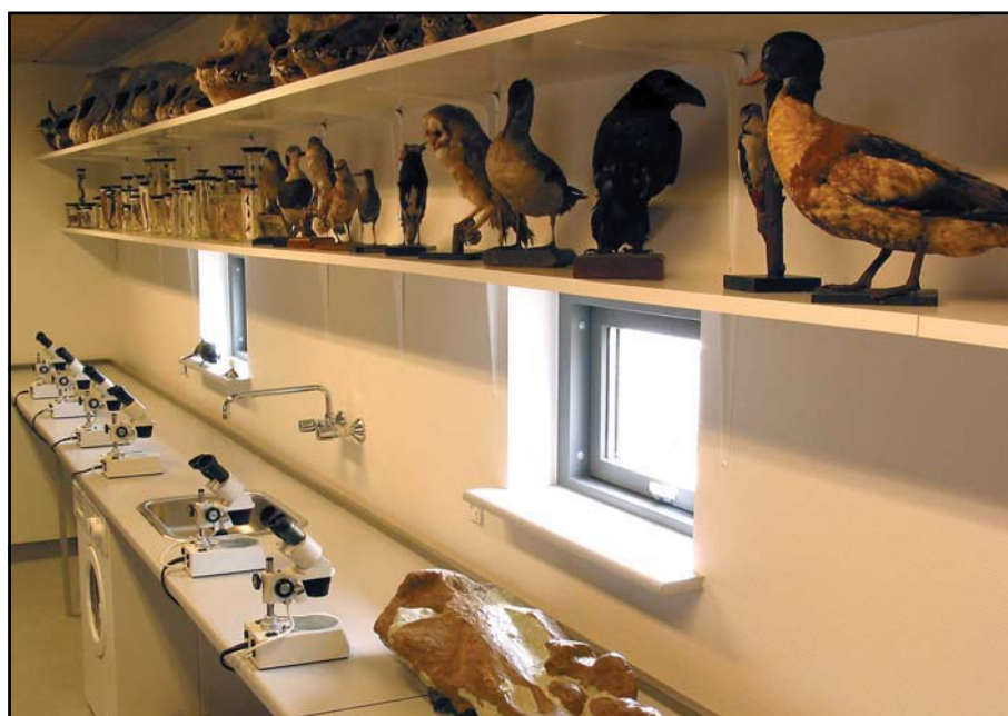
Det nyindrettede laboratorium.

Det har været et billigt museum, der dog ser ud af langt mere, end det har kostet, og det er blevet et funktionelt museum, der dækker de behov, vi har til udstillingerne af de mange fossiler fra Gram lergrav. Her er ikke ekstra plads, som i flere store nybyggede og dyre projekter, men her er plads nok til løsning af vort kerneprojekt: geologien og palæontologien i det øvre miocæne Gram ler.