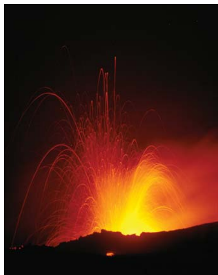
Etna i udbrud, 2001.

Disse vulkaner har været i udbrud mere end 100 gange i løbet af de sidste få hundrede år. De fleste af disse udbrud har været eksplosive. Den enkelte vulkan kan dog ligge i dvale i adskillige århundreder, og derfor synes risikoen for et ødelæggende udbrud ikke altid nærværende. Når vulkanerne så endelig kommer i udbrud, medfører det