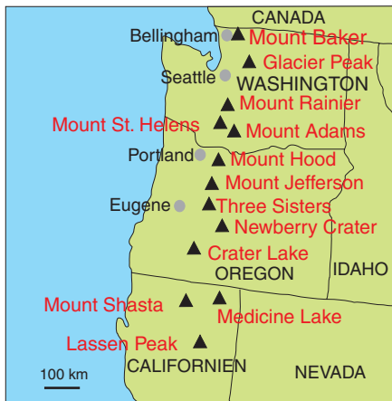
Den geografiske placering af vulkanerne i Cascade Range, USA. Flere af vulkanerne ligger inden for en afstand af 100 km fra større byer og betragtes derfor som farlige. (Grafik: Forfatteren)

nyet seismisk aktivitet under den slumrende vulkan South Sister i det centrale Oregon, USA. I den forbindelse vil der denne gang være et kort afsnit om den potentielt truende vulkanisme i Cascade Range i det vestlige USA i stedet for det sædvanlige afsnit om længerevarende vulkansk aktivitet.