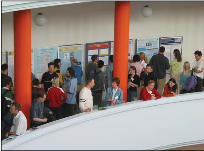
På balkonerne i Geocentrets rotunda kunne konferencedeltagere nærlæse de mange poster.