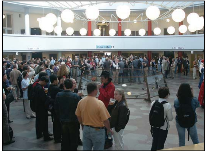
Ice breaker'en bød på mangt en hyggesnak mellem kolleger – og et glas øl trods et defekt fadølsanlæg.

Tema 1: En 65 millioner år gammel krokodilles menukort afsløres vha. kulstofisotopiske analyser af tændernes vækstringe.