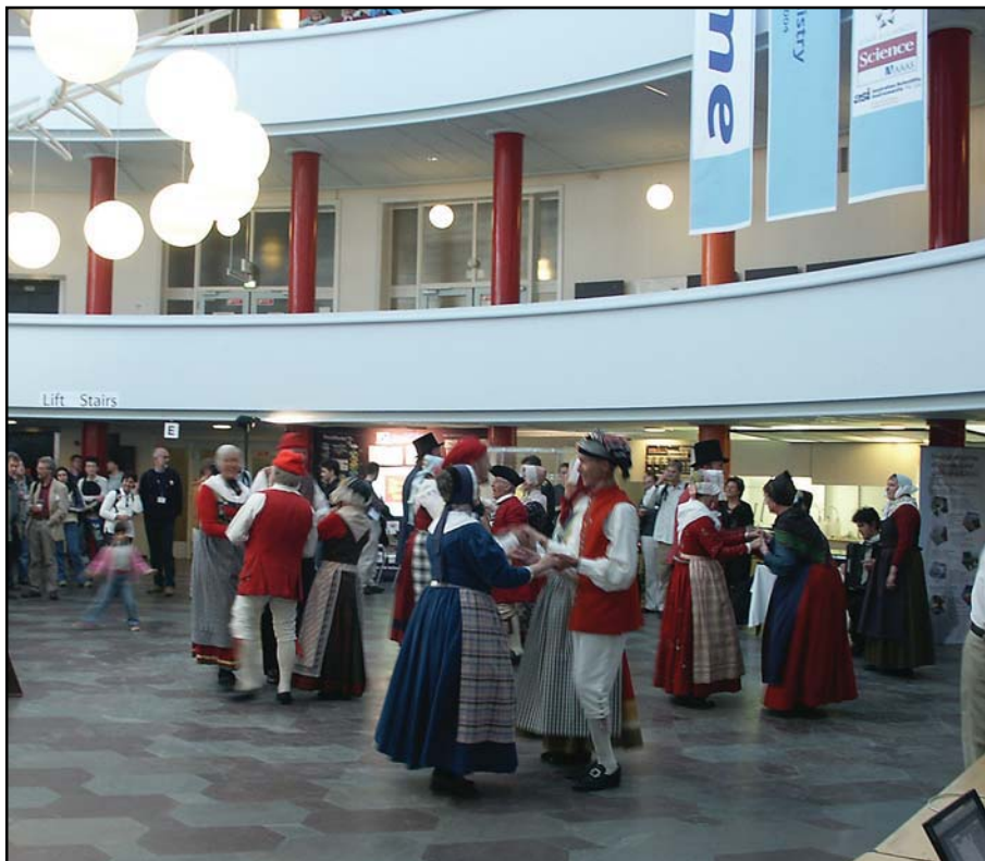
Goldschmidt 2004 indledtes med en "ice breaker" på Geocentret. Ved den anledning fik rotundens Foucault-pendul konkurrence fra festligt klædte folkedansere.

Temainddelingen har gjort det relativt enkelt at planlægge, hvilke af de mange foredrag man ville høre. Foredragene blev af tidsmæssige årsager afholdt i parallelsessioner i auditorier fordelt på Københavns