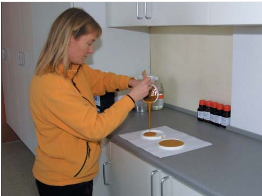
I produktudviklingen indgår en del laboratoriearbejde. Her laves der en prøve af en polyurethan-gulvbelægning, der blandt andet bruges i fødevarerindustrien eksempelvis mejerier og slagterier.