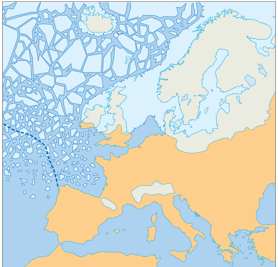
Det Skandinaviske Isskjolds maksimale udbredelse i slutningen af Mellenweichsel baseret på forskellige forfattere. Baggrunden for forløbet i den vestlige del af Nordsøen er beskrevet i teksten. Den stiplede linie angiver havens grænse om vinteren. (Grafik: Steen Frimodt)

Jeg går ud fra, at NKL har forståelse for, at man i en bog, der henvender sig til lægfolk, ikke kan have hele det videnskabelige apparat med (hvilket i parentes bemærket ikke er ensbetydende med, at de