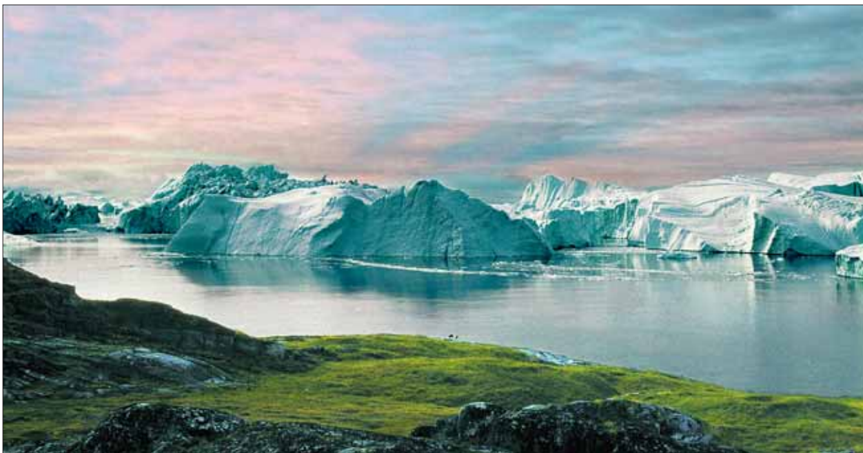
Både USA og Sovietunionen har indsamlet store mængder bathymetriske data fra Polarhavet ved hjælp af ubåde

Af Louise Halkjær og Steen Laursen, GeologiskNyt