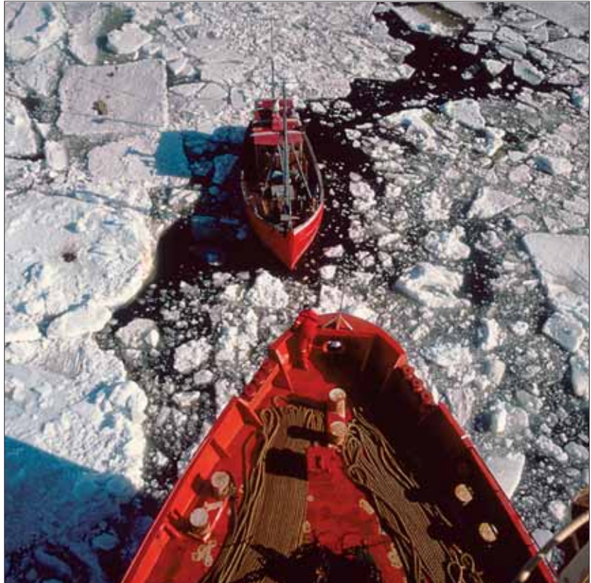
De ekstreme vejrforhold i Polarhavet gør, at området geologisk set er et næsten uudforsket område.