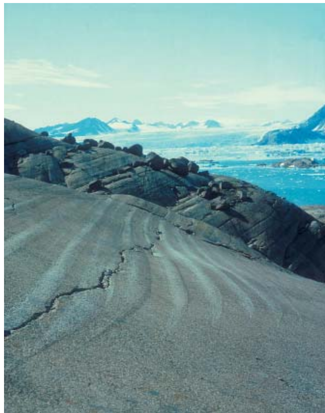
Magmatisk lagdeling i Skærgårdsintrusionen.

multinationale kapitalinteresser netop denne sommer fået farten af stedet. Bjergartsformationerne har en ikke ringe lighed med Sydafrikas platinmalm, og nu havde kapitalisterne altså lagt sig på sinde at skænde helligdommen. De multinationale virkede nu ikke særligt frygtindgydende, og de skjulte deres kapital forbausende godt. Deres hovedsæde bestod af en stor presenning, som var hængt op under et lille klippefremspring. Presenningen havde muligvis til formål at beskytte de fire kapitalister mod de tilbagevendende regn- og snebyger, men i praksis virkede den som en slags kondensator. I tørvejr samlede den på sin inderside med stor nidkærhed de