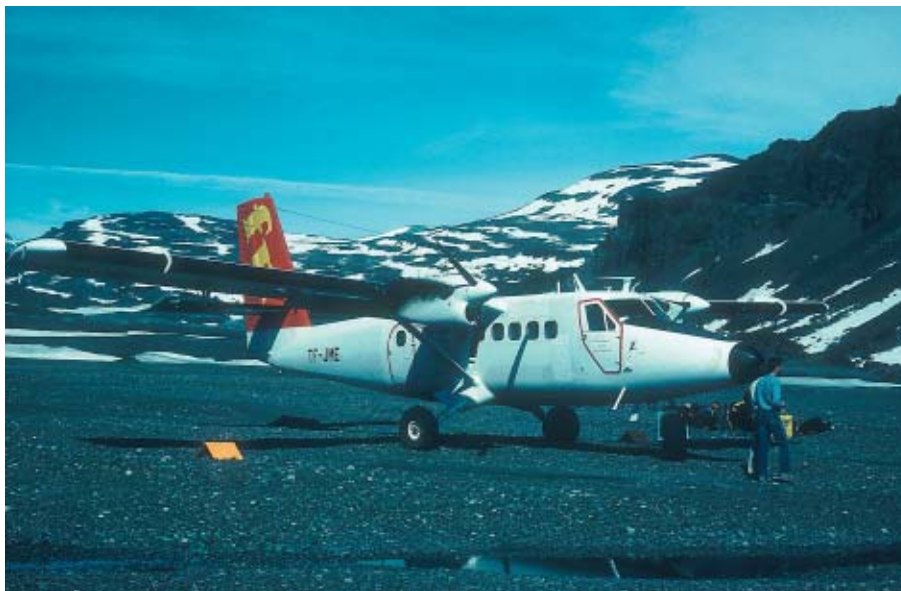
Twin-Otteren på grusbanen i Sødalen.

Skærgården udgør sydenden af Blossvillekysten, som udmærker sig ved at være Arktis' sureste og mest stormombejlede kyststrækning. Her samles polhavets drivis under havstrømmenes fokusering i tragten mellem Island og Grønland og sørger for, at den smalle bræmme af kystland altid er hyllet i en bidende kold frosttåge. På landsiden ligger et vildt og alpint land, hvor sorte basaltrapper fører op til indlandsisens ligeegyldighed. Set sydfra danner Skærgården nordøsthjørnet af Kangerlusuaq-