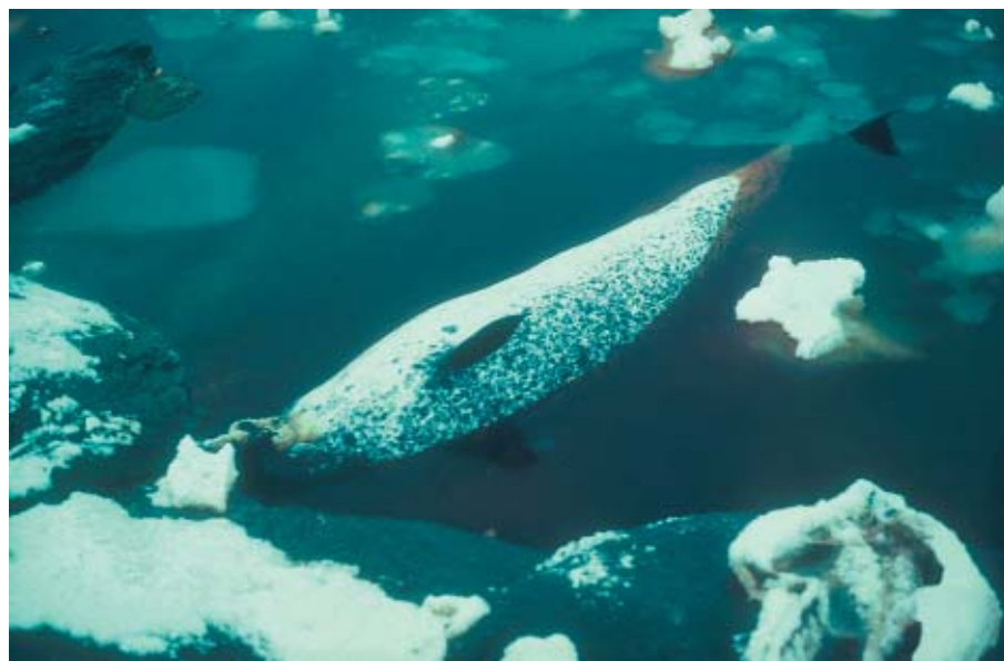
Narhval på køl ved Skærgården.

Efter at Skærgården i 50 år udelukkende havde tiltrukket akademiske geologers naive og ædle opmærksomhed, havde de