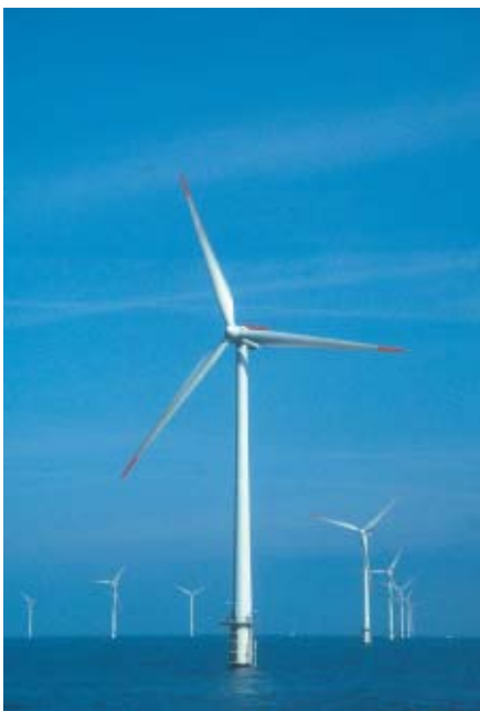
Vue over vindmølleparken.

I forbindelse med servicearbejde på møllerne kræves der ekstra sikkerhed, og derfor har servicefolkene været på offshore-kurser og desuden haft udvidet førstehjælp. Hver vindmølle indeholder koge- og varmeapparat, toilet, ildslukkere, førstehjælpsudstyr, 4 soveposer og liggeunderlag samt 12 måltider og vand i tilfælde af rigtigt dårligt vejr, hvor folkene ikke kan komme tilbage på land. Hvert servicehold har mindst to VHF-radioer, så de kan kontakte land i nødstilfælde.