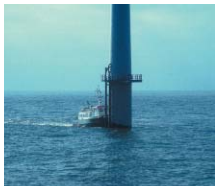
En mølle besøges via båd.

Fordelen ved at anlægge mølleparker til havs er i første omgang, at hver mølle opnår en halv gang så stor produktion, som hvis den havde ligget på land. Desuden virker de ikke så forstyrrende på havet som