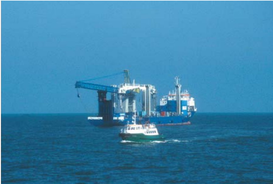
Det specielle kranskib anvendt til møllemontage ses bagest og i forgrunden et mindre skib, der kan anvendes til adgang ved vindmøllerne.

bedst at anvende helikopter, selvom helikoptertransport er dyrere. Til hovedrevision af parken vil der dog blive anvendt et større skib, og man regner med i snit to ordinære servicebesøg på hver mølle pr. år. Møllens levetid er anslået til ca. 20 år