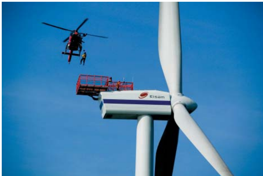
Demonstration af hoist-teknikken – servicepersonale fires ned på én af vindmøllerne.

len. Den samlede vægt pr. mølle ligger på mellem 439 og 489 tons. Transformatorstationen, som møllerne er forbundet til offshore, vejer omkring 1.400 tons – alt i alt er der ca. 37.000 tons udstyr i hele vindmølleparken! Parken blev altså ikke lige bygget på én dag.