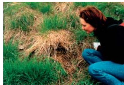
Der er ikke kun geologi på Mogenstrup Ås. Her ligger der fx en rede.