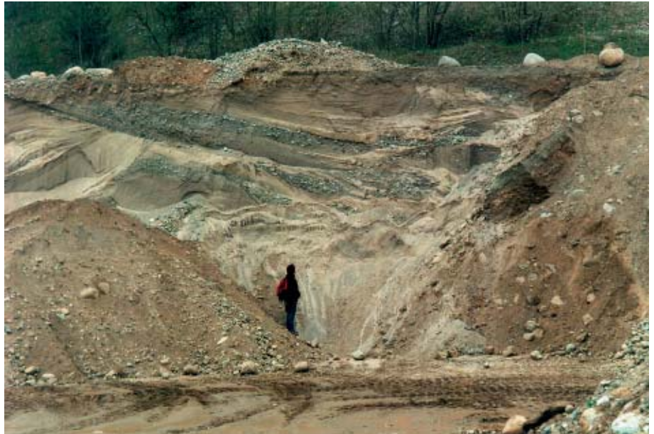
Et kig på et profil ved foden af sydflanken på Mogenstrup Ås.

Det er især åsens geologiske betydning, der er kilde til protesten. Sammen med Miljøministeriet fastslår halvdelen af indsigelserne mod gravningen først og fremmest, at den del af åsen er Nationalt Geologisk Inter-