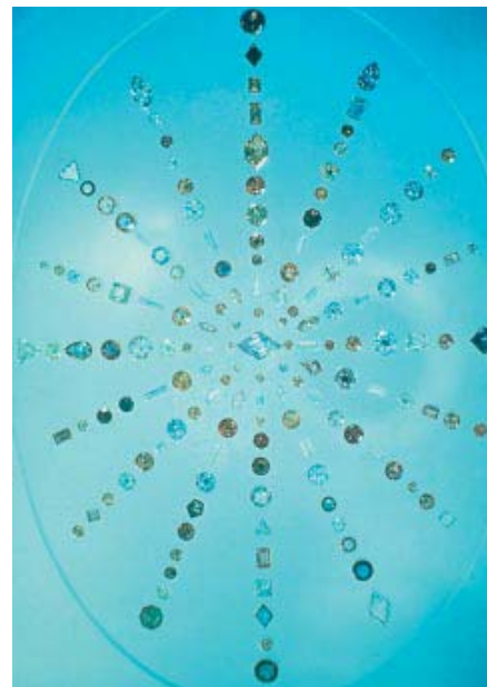
Slebne diamanter i forskellige farver.

Nu er der så kommet et område, hvor syntetiske diamanter måske i fremtiden kan finde deres anvendelse. Det er lykkedes at fremstille syntetiske diamanter, som har halvlederegenskaber sammenlignelige med silicium. Ved at dyrke mindre diamanter på en større diamant og ved at tilsætte en diboran-gas under processen inkorporeres der små huller i diamanten, hvor elektroner kan strømme uhindret igennem. Selvom man kunne opskalere processen, er det dog usandsynligt at diamant-chips erstatter de silicium-chips, vi kender i dag. I stedet vil de sikkert finde anvendelse inden for meget specialiserede områder som i radarer eller elektriske kredsløb i satellitter, som kræver stabilitet i stærkstrømsapplikationer ved høje temperaturer.