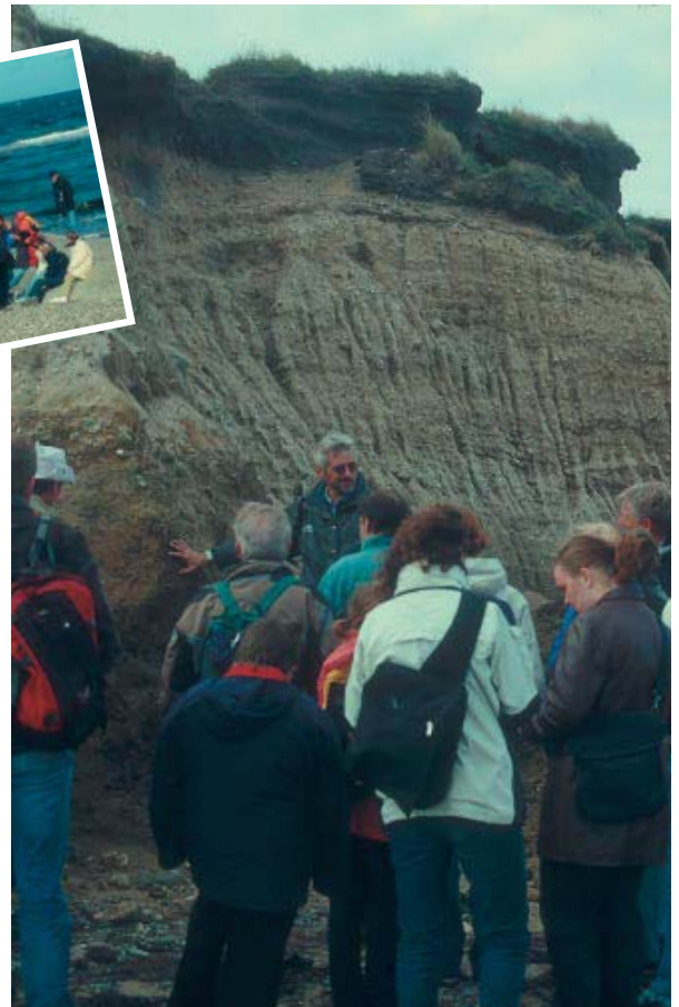
Guiden fra Amtets Råstofafdeling udreder områdets geologiske historie.

for syntesegeografi. Begrebet syntesegeografi dækker over koblingen imellem naturgeografi-geologi og human-kulturgeografi. I starten af 2002 afholdes et seminar, hvor forskere fra relevante institutter på AAU er inviterede til at medvirke, udvikle og påvirke det kommende geografiske forskningsmiljø. Et nystartet forskningsmiljø må nødvendigvis udspringe fra nyanfattede og eksisterende kompetenceområder. Indtil nu er der blevet ansat 2 geologer/naturgeografer som adjunkter i 2002 med speciale i hhv. gabbroiske intrusioner/økonomisk geologi og vandbevægelse og kemiske processer i de øverste jordlag. Det er planen at der i alt skal være ansat mellem 4-5 naturgeografer/geologer i løbet af de næste par år så længe optaget ligger på ca. 20 studerende pr år, som det har været tilfældet i 2001 og 2002. ■