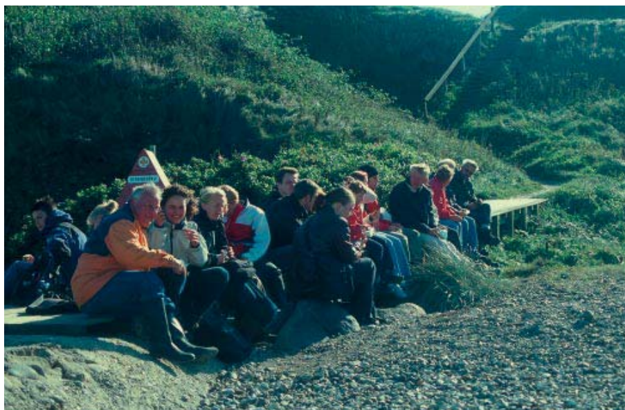
Studerende og andet godtfolk tager en frokostpause under turen til Ertebølle i forbindelse med Geologiens Dage i efteråret 2002.

Temaerne for disse tre semestre er hhv. natur-, kultur-, og syntesegeografi. Efter bacheloruddannelsen er det planen at tilbyde overbygninger i GIS, naturgeografi/geologi, syntesegeografi og kulturgeografi, der skal bringe de studerende til kandidatniveau.