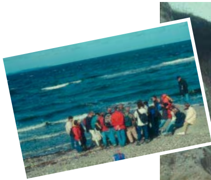
Strandstenenes oprindelse diskuteres flittigt.

Ingeniør- og andre naturvidenskabelige uddannelser ved AAU har en solid tradition for nært samarbejde med private såvel som offentlige virksomheder. Det tilsigtes også at implementere denne tradition inden for den geovidskabelige forskning ved AAU. Forskningsmæssigt søger geografi ved AAU at oparbejde kompetence inden