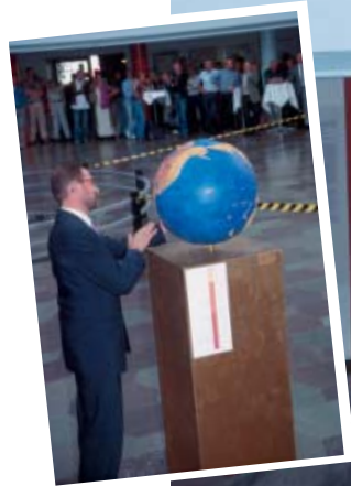
Forskningsminister Helge Sander drejer på jordkloden og aktiverer derved vulkanen.

De fem institutioner, der nu – bortset fra Geologisk Museum – er kommet under samme tag, er Danmarks og Grønlands Geologiske Undersøgelser (GEUS), Dansk Lithosfærecenter (DLC), Geologisk Institut samt Geografisk Institut, der har fået fællesadresse på Øster Voldgade 10.