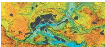
Landskabets højdekurver med de store dalstrøg omkring Silkeborg. Forskellige linieføringer for en motorvej er indtegnet.

Måske kan vi finde en allieret i biologerne i denne sag, idet Gudenådalen er et EU-habitatområde. Det har før vist sig at være uhyre effektivt. Det er dyrearter som odder, damflagermus og grøn kølleguldsmed, som vil blive generet af denne motorvejslinieføring.