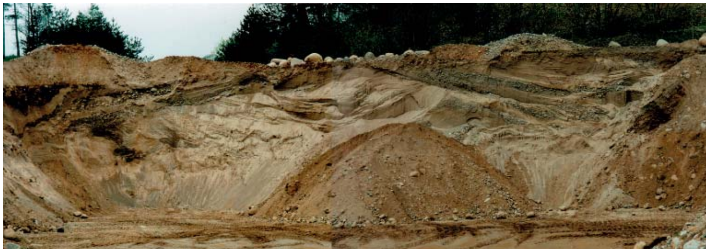
Et geologisk snit igennem Mogenstrup Ås - vinkelret på smeltevandets strømretning. Bemærk kanaludfyldningerne i toppen af profilet.