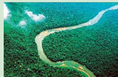
Orinoco-floden fra oven. Arkivfoto.

I Orinocos delta lever Warao-indianerne, et af Venezuelas største indianske folkeslag, men deres fremtid ser måske ud som farven på den olie, der i stigende grad bores efter i dette område. Indianerne er nemlig afhængige af den føde, som deltaet naturligt kan levere. Sådan har de gjort de sidste 1000 år, men da deltaet udgør et meget ømfindeligt økosystem, risikerer de nemt at måtte bukke under for den øgede forurening, der er konstateret gennem de senere år.