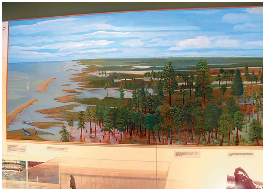
Illustration der viser den vestlige del af Danmark i Miocæn.

alternative tolkninger. Det gælder f.eks. diskussionen af Kridt/Palæogen grænsen. Andre gange støder man ind i, at et vigtigt emne er forbavsende dårligt belyst – her kan f.eks. nævnes flintdannelse eller skiftet fra kalk til klastisk aflejring i Paleocæn. Fagfolk vil dog nok notere sig, at der står ganske meget også mellem linjerne, for i mange tilfælde har vi valgt at “træde vande” i forbindelse med mere eller mindre kontroversielle forklaringsmuligheder. I det hele taget har det været lidt ejendommeligt gentagne gange at erkende, at det langt hen af vejen har været hensyn til fagfæller og deres mening, som har været afgørende for skrivemåder og fremstilling.