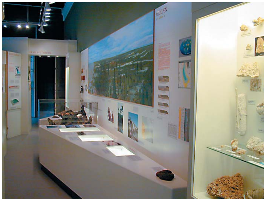
Et moderne eksempel på hvordan Miocæn kan formidles. På væggen hænger et stort maleri, som viser de geologiske miljøer på tværs af Danmark i Miocæn. I monterne under maleriet ses repræsentative håndstykker og fossiler fra perioden. Den høje kasse midt i billedet indeholder f.eks. hjernekassen fra en hval fra Gram Lergrav.

Med en programmerklæring om formidling til et publikum uden geologisk viden ligger det i sagens natur, at de fleste fagtermer er for tekniske. Selv almindelige termer som f. eks. tektonik, sediment og forkastning er derfor undgået. Problemet med omskrivninger er dog, at de næsten altid er længere og mindre præcise end fagtermerne, hvilket alt i alt resulterer i længere tekster, end hvis det havde været muligt at anvende