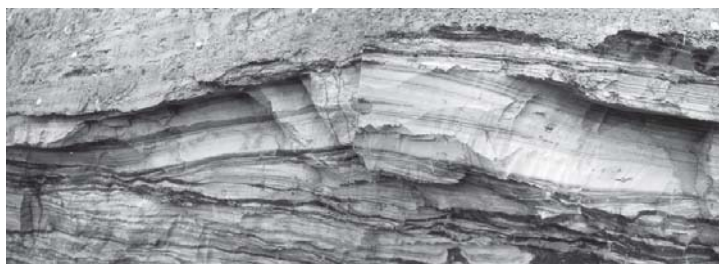
Hvælvede aflejringer afsat i et brakvandsmiljø, også under en storm. Bemærk også her den interne trunkering af lagdelingen.

Profilet er beliggende ved den gamle Lillebæltsbro mellem Fyn og Jylland. Kommer man fra Jyllandssiden, skal man umiddelbart efter, at man er kommet over på Fynssiden dreje til højre ind på en parkeringsplads. I nordenden af denne parkeringsplads findes en trappe, der fører ned til stranden. Her går man under broen, og profilet ligger så på den vestlige side af broen i skrænten hen mod lystbådehavnen ved Kongebro. ■