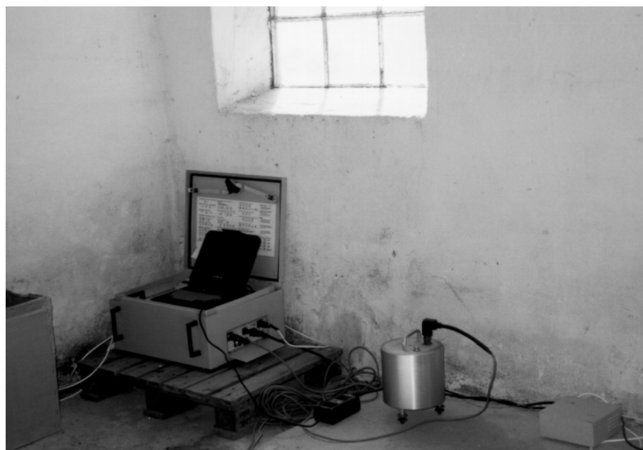
Opstillet seismografi i feltet – her inde i en bygning på Stevns.

Den store "antenne" af seismografer kan tillige benyttes til specialstudier af dybe geofysiske/geologiske strukturer i fjerne egne af Jorden. Herudover virker de mange seismografer som et fantastisk supplement til de permanente seismografer ved studiet af små lokale jordskælv. For sidstnævnte er der dog ikke konkrete projekt-planer, da man endnu ikke har overblik over disse muligheder. ■