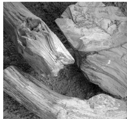
Forstenede træstykker m.m. fundet i moleret på Mors.

Tilslut vil vi nævne, at der findes en geologisk samling i Gedser, et ravmuseum i Skagen samt en stensamling ved Skærum Mølle. Du er meget velkommen til at kontakte GeologiskNyt på tlf.: 89423519 eller fax 86180037 med oplysninger om andre geologiske samlinger, som bør omtales.