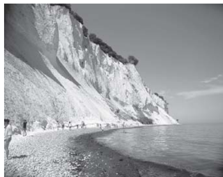
Møns Klint er et imponerende syn.

GeoCenter Møns Klint bliver et geologi- og naturcenter, der med udgangspunkt i kridtet skal fortælle om klintens tilblivelse og om de voldsomme geologiske processer, som har skabt Danmark. Det er historien om livet i kridthavet og de mange forstærninger, man kan finde på stranden, Tertiærtidens voldsomme geologiske forandringer og om istidernes indflydelse på det danske landskab, hvor kronen på værket er gletschernes opskydning af Dronningestolen.