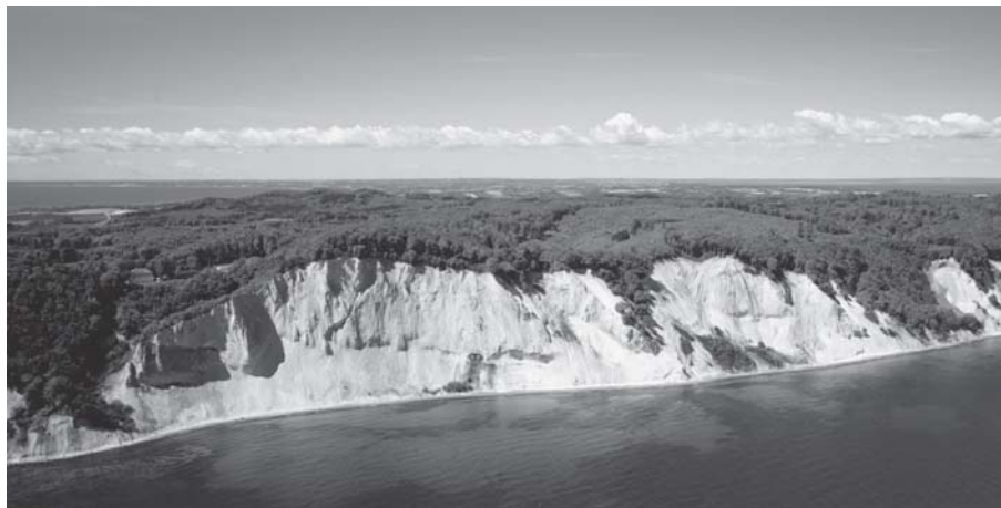
Møns Klint set fra luften.

Vinderforslaget lader kulturen formidle naturen. Kulturpersonlighedernes fortolkning af naturen i „Hulemalerierne“ skal opleves i et samspil med „Tidstunnelen“, som er rygraden i centret. „Tidstunnelen“ skal med moderne tekniske hjælpemidler