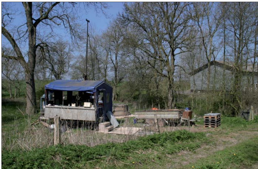
Ovenfor ses boringens placering. Nedenfor til højre ses dele af borekernen fra Nedre Kambrium.

"Kan denne kerne så bruges til noget?" – Hertil må svaret være et rungende "Ja!". Borggård-1-kernen giver en helt unik mulighed for at forstå udviklingen af Nedre Kambrium på Bornholm. Og selvom dette stratigrafiske interval ikke nødvendigvis er mere spændende end andre intervaller, så er