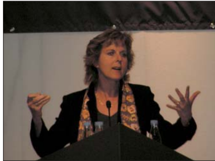
Connie Hedegaard talte varmt for ny miljøteknologi.