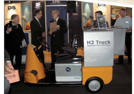
H2 Trucken vejer 450 kg og har en tophastighed på 15 km/t.

På Energistyrelsens stand kunne man få gode råd om solenergi og besparelser i længden i forhold til fossile brændstoffer.