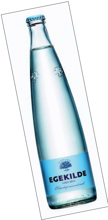
Egekilde, det nyeste danske mærke på markedet. I følge etiketten er det rene krystalklare vand nænsomt rensat ved århundrede-lang filtrering gennem kalkundergrunden. Et indhold af fluorid på 0,9 mg/l tyder på, at det er indvundet fra kalklag. Fluorid i små mængder er muligvis godt for tænderne.