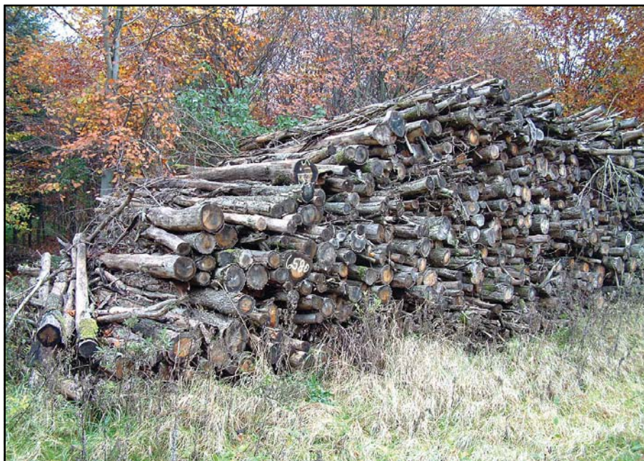
Næste års brænde ligger parat ude i skoven. Det skal bare kløves og lægges til tørring.

Tendensen kan ligeledes ses i statistikken over, hvor meget træ der bliver produceret i Danmark med det formål at blive anvendt som brænde. Således er produktionen steget med 30 % fra 1990 til 2002. Umiddelbart er det forståeligt nok, at danskerne ønsker at