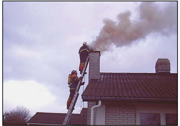
Sådan kan det gå, hvis forbrændingen ikke har fået luft nok. Langt de fleste skorstensbrænde skyldes brændeovne, der enten er blevet opfyret med for vådt træ, eller har fået tilført for lidt luft, og dermed danner løbesod i skorstenen.

Nu sidder den, efter at have læst denne artikel, ulykkelige brændeovnjeere nok og overvejer, hvad han kan gøre. På længere sigt er der hjælp på vej. Filtre til montering på skorstenørret bliver produceret, men er endnu meget dyre, hvis de da er til at få fat i. Indtil da er der nogle gode råd, man kan følge. Grundlæggende gælder det om at opnå en så høj forbrændingstemperatur som muligt. Derfor gælder det om kun at fyre