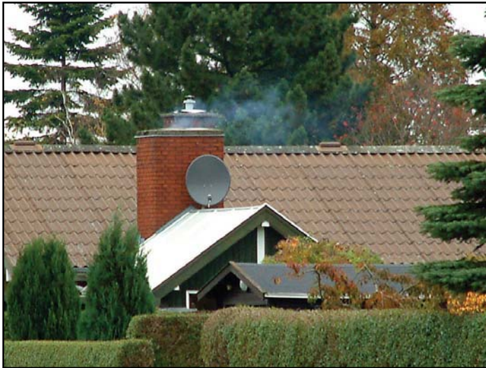
Typisk brændeovnmiljø: Parcelhus, lav skorsten og høje træer omkring huset. Bemærk, at røgen holder sig nede i hushøjde.

Noget af det, der har været diskuteret meget i forbindelse med sammenhængen mellem partikler og helbred, er, hvilke partikelstørrelser, der er de farligste. Vores nuværende viden bygger i høj grad på nogle amerikanske kohortestudier (undersøgelser hvor en gruppe personer følges gennem flere år for at sammenholde partikelkoncentrationer med sygdom og dødsfald) for fine partikler, hvorimod der for ultrafine partikler (diameter mindre end 0,1 µm) kun er undersøgelser af akutte effekter. Imidlertid er der fremkommet en lang række indici på, at deres indflydelse på helbredet er væsentlig større, end det er tilfældet for fine partikler. Årsagen til dette er, at ultrafine partikler kan trænge længere ud i lungerne og herfra blive optaget i blodet. Ved længere tids eksposering for fine partikler og altså formentlig også for ultrafine partikler stiger risikoen for at få hjerte-karsygdomme, kræft og kronisk bronkitis – hvoraf de to førstnævnte ofte fører til dødsfald.