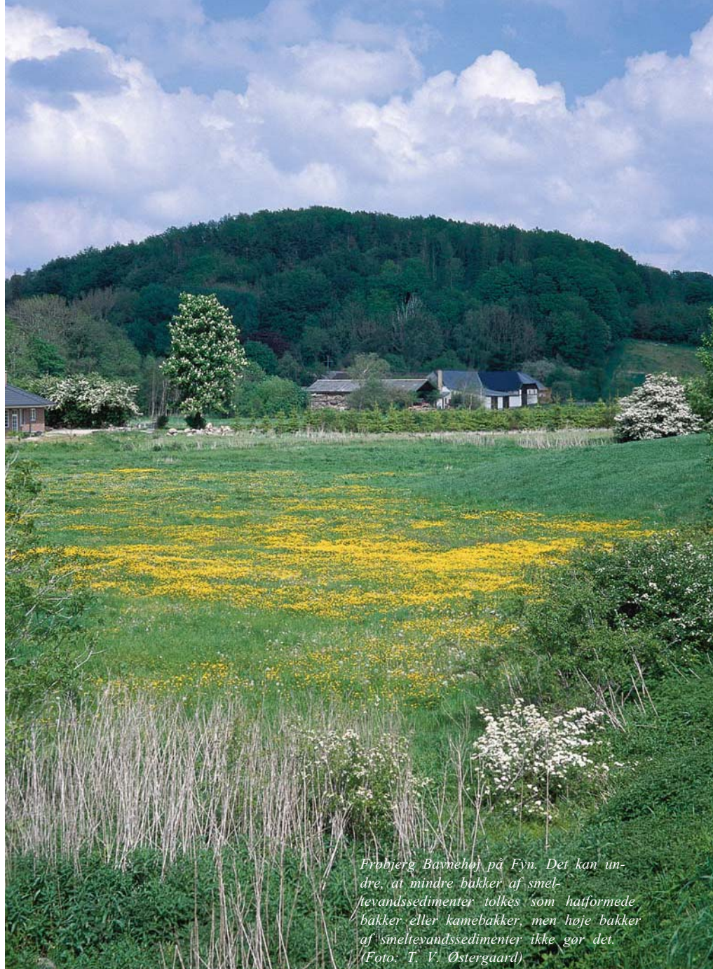
Frøbjerg Bavnehøj på Fyn. Det kan undre, at mindre bakker af smeltevandssedimenter tolkes som hatformede bakker eller kamebakker, men høje bakker af smeltevandssedimenter ikke gør det.