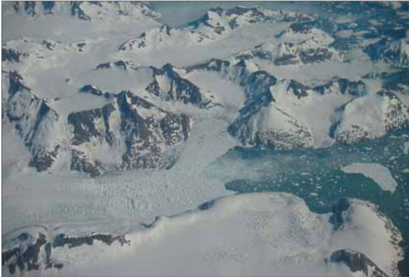
Foto fra Østgrønland; kælvende gletschere.

Men de kommende års undersøgelser af Polarhavet, foranstaltet af dets naboer, vil give et meget detaljeret billede. Det er nemlig forudsætningen for, at en nation kan kræve sin del af dets ressourcer. ■