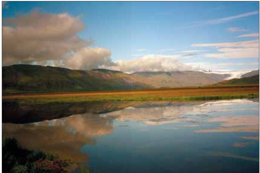
Det er denne smukke islandske natur, der tiltrækker flere og flere turister, som er vigtige i den islandske økonomi; fjeldene undersøges for ædelmetalforekomster.

Men svovl kan også frigives, før lavaen når jordoverfladen flere km under jordoverfladen i hjertet af vulkanen – i vulkanens magmakammer (magma = smeltet stenmasse som potentielt kan størkne på stor dybde; lava er magma, der er kommet ud af en vulkan). I dette magmakammer afkøles og udkrystalliseres basalten, og herved nedsættes basaltens evne til at op-