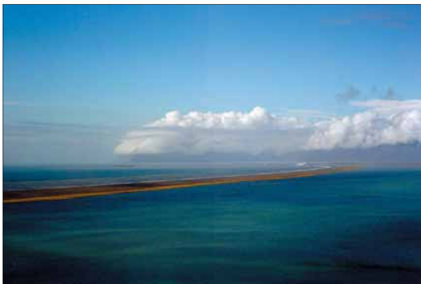
Billede af kysten af det sydlige Island ved Lónsvík. Havet (tv. i baggrunden) har samlet det sorte sand af vulkansk oprindelse til en barriere foran kysten. I den associerede lagune (th. i forgrunden) nyder fugle beskyttelse fra Nordatlantens bølger. Feltarbejde fra teltlejr var særligt godt i år pga. den fine islandske sommer i 2003.

Studenter og forskere fra Aalborg og Aarhus Universitet er lige vendt hjem fra feltarbejde i Island, hvor formålet blandt andet har været at indsamle prøver, som skal analyseres for ædle metaller såsom guld, platin og palladium. Prøverne er taget fra de forstenede hjerter af ca. 6 mio. år gamle islandske vulkaner, som kun er blottede få steder på den nordatlantiske ø. Prøveindsamlingen i år er foregået ved foden af Europas største gletscher Vatnajökull i det sydøstlige Island. Forskningsprojektet vil ud fra indholdet af ædle metaller i prøverne vurdere potentialet for naturgivne økonomiske ædelmetalforekomster i Island samt bidrage med ny indsigt i metallogene i vulkanske komplekser generelt.