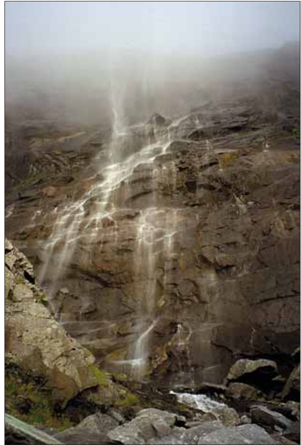
Indsamling af prøver på de højeste lokaliteter bringer én op til skyernes underkant. På billeder skjuler vandfaldets øvre del sig i skyens skorter.

og hvor vulkansk materiale vælder op og danner ny jordskorpe. Oceanbundsspredning er i dag aktiv langs en vulkansk højderyg, der strækker sig fra syd til nord midt i Atlanterhavet. Det specielle ved spredningsryggen ved Island er, at den her ligger over et ekstraordinært varmt område af jor-