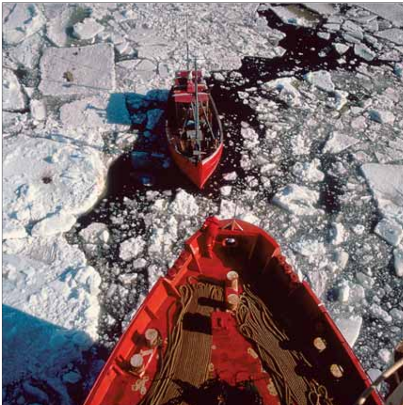
De ekstreme vejrforhold i Polarhavet gør, at området geologisk set er et næsten uudforsket område.

Måske kan man få Canada med i et samarbejde om et fælles projekt og deles om udgifterne. De har også interesser i området nord for Grønland og vil snart gå i gang med at indsamle data. Der er endnu ingen aftale om, hvor grænsen mellem de danske og canadiske krav skal gå, men Christian