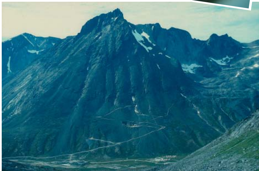
Fjeldet Qaarsutsiaap Qaqqaa på vestsiden af Kirkespirdalen med sine 4 mineindgange. I dalen ses lejren og malmlageret i august 2002.

Lønsomhedsanalysens ressourceberegninger efter sæsonen 2002 fastslår, at der i Nalunaq-forekomsten nu på baggrund af en