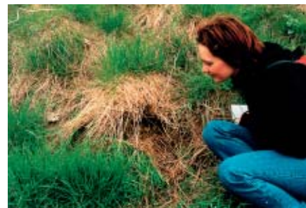
Der er ikke kun geologi på Mogenstrup Ås. Her ligger der fx en rede.