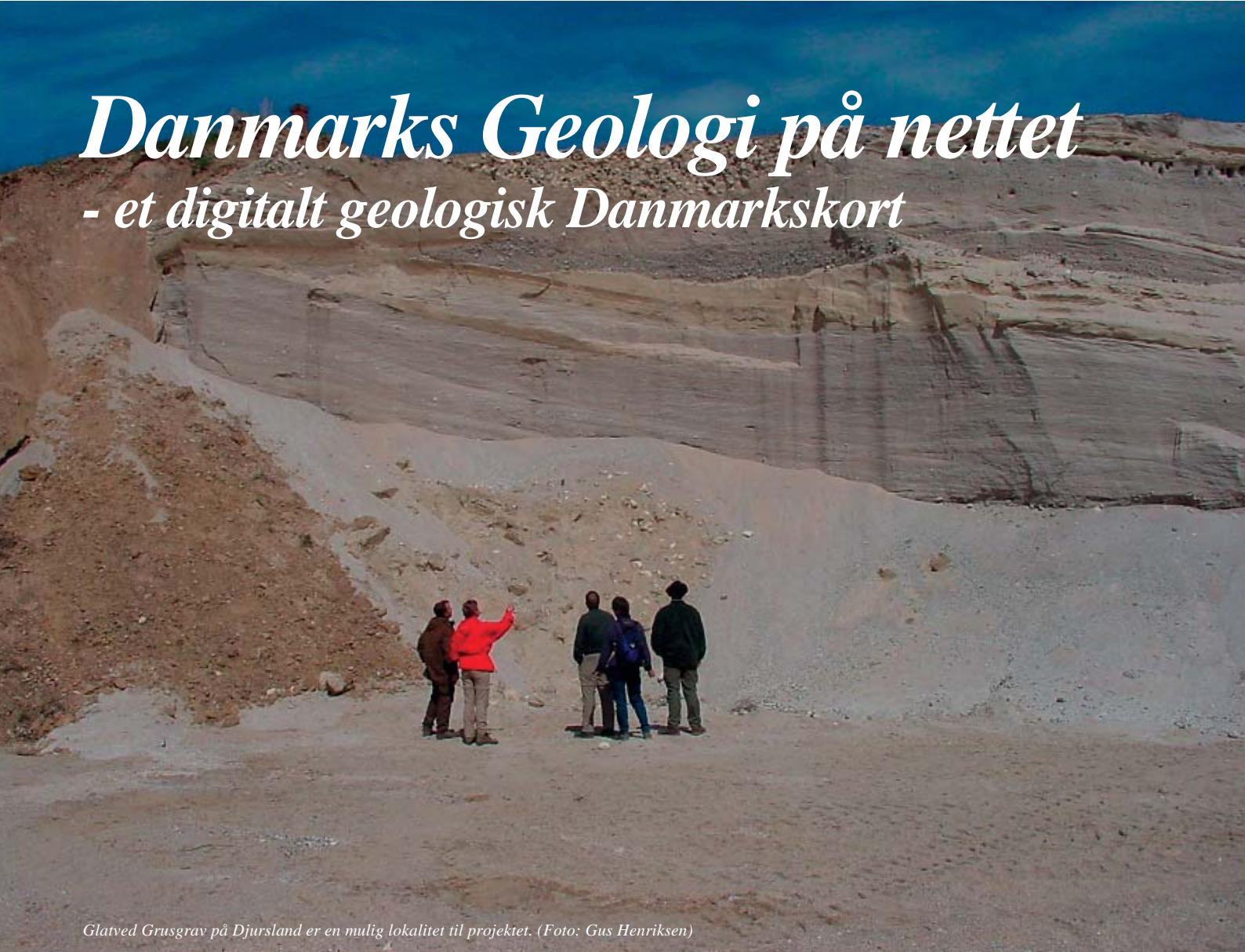
Glatved Grusgrav på Djursland er en mulig lokalitet til projektet.

Af geolog og projektleder Tove Stockmarr, Midtsønderjyllands Museum