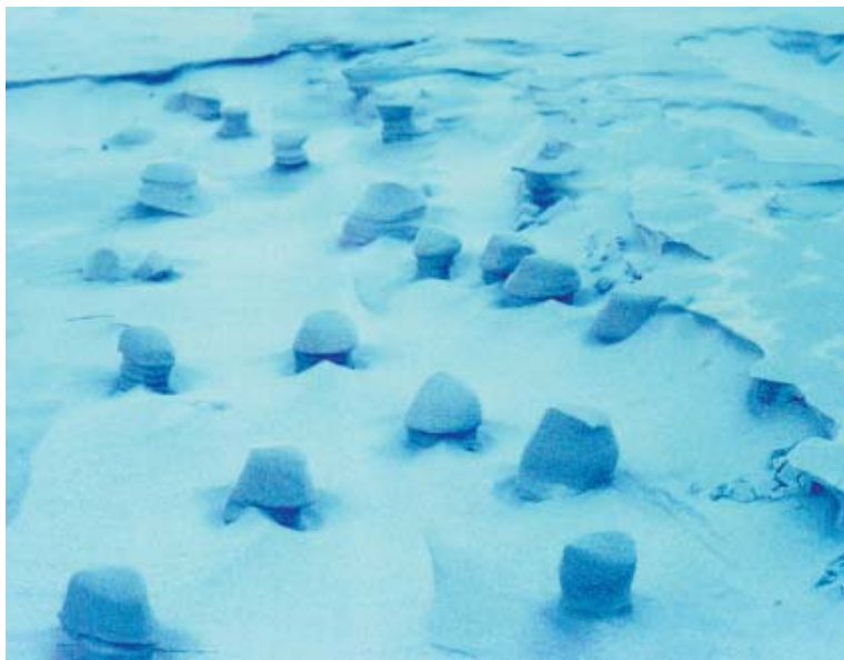
Fotoet er fra 1972 på Anholt.

Tilsvarende er set en vinterdag – ligeledes på Anholt, hvor fænomenet (de enkelte "søjler") i Anholt-Posten 2001 er beskrevet "som værende 25 - 50 cm høje, stivfrosne og befindende sig ca. 200 m fra vandkanten". ■