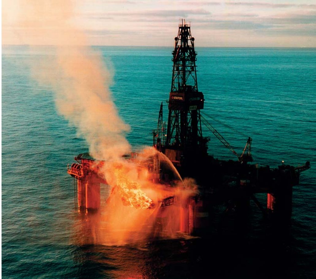
Semi-sub-boreriggen "Deep-sea Bergen" tester olie i den boring, som fandt "Siri-feltet". Operatøren var Statoil, og det foregik i december 1995. Afbrændingen af olien (og dens associerede gasser) udvikler så meget varme, at den del af riggen, der er tættest på brænderbommen, må afkøles med vand.

KS: Man styrer borer ved hjælp af en borekrone, hvis vinkel til borestrengen kan varieres. Denne type af borer giver øget risiko for, at hullet bliver ustabil, og boringer, der afviger stærkt fra vertikalen, er det vanskeligt at logge konventionelt. Vandrette borer er af særlig betydning i Danmark. Den stigende udnyttelsesgrad, som karakteriserer produktionen fra de danske felter, har som en forudsætning brugen af horizontale borer. Med denne teknik kan de producerende borer placeres i selve reservoirlaget over afstande, der måles i kilometer. Det øger naturligvis produktionen fra den enkelte boring. Man bruger også i stigende omfang vandinjektion fra horisontale borer til at presse olien gennem reservoiret hen til produktionsboringerne. Muligheden for at styre boringer er således en af de tekniske "revolutioner", der har haft afgørende indflydelse på dansk olieproduktion. Mærsk har været blandt de førende i denne udvikling.